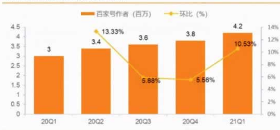
图 11: 百度百家号作者数 (百万) 及环比增速