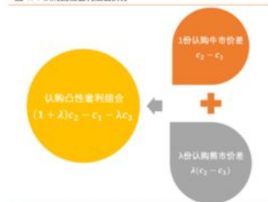
图 47：认购凸性套利组合拆分

单异常无法取款，遇到注单异常、违规操作等借口，如果超过24小时了还不能出款，那么可以肯定是被黑了，这个时候我们该怎么解决好，这种情况，如果你真的赢太多了，那么平台客服就会告诉你，你套利了，违规操作了，还有就是流水不足，你有刚开始赢钱了，那么就不要再考虑什么了，赶紧了全部提处理，不然后期赢的更多想出款，就更难了。