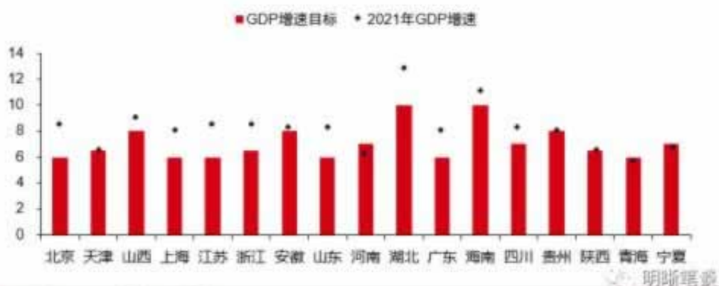
图 2: 2021 年地方两会 GDP 增速目标与 2021 年实际增速 (%)

答：有些债，不单单只是钱，还有情，还清黑网欠的钱是必然的，还清黑网欠下的情也是必然的。