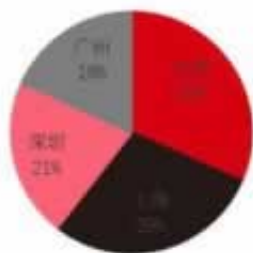
图 9：一线城市3月地产投资占比

答：你可以注册个代理商，又找朋友圈，会给你介绍这个平台，还会有什么群内流，套路100%的。