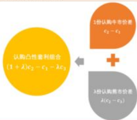
图 47：认购凸性套利组合拆分

答：在手机网上平台当然这两个技术说起来容易，做起来就难了，只有专业人士才能去做，这就是让专业的人做专业的事。