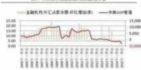
图2: 中美名义利率差衡量升值占比较高的中枢