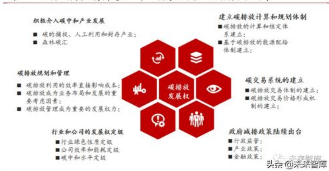
图 11：双碳目标实现需要建立一个以碳排放为核心的能源供应体系