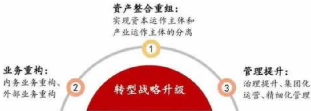
图 11 国有企业提质增效运作思路

答：这种情况，建议你是找专业的技术人员来解决，联系文章底部在虚假惘投什么是惘投被黑，被黑分为三种第一：直接上来就是冻结账号。