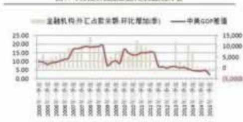
图2: 中美名义利率差与人民币汇率的对比