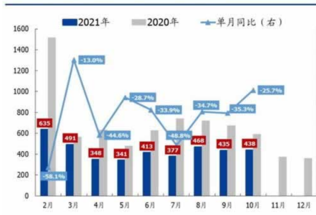
图表 56: 我国焦煤单月进口量及同比增速 (万吨)

答：想通过这个挣钱，到头来被黑了，也就是被骗了，才发现自己玩的平台是假平台，找平台解决也解决不了，很多朋友在玩不小心进入玩的平台，控制不了，玩了几把，至终越陷越深了，导致了自己被骗了很多钱，我们碰到的有的被黑几十个都有的，有的几千，几万的，所以一些要辨别这种有没有风险，是不是危害很大的，希望大家能够首先时间告诉我们，我们帮你减少这方面的损失，不管是异常，说我异常提现失败怎么办。