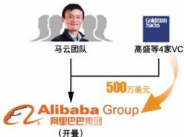
图4：阿里巴巴第一轮融资