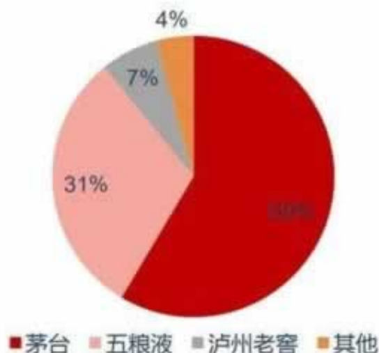
图 17: 按销售额划分高端酒的市占率 (%)