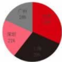
图 9：一线城市 3 月地产投资占比

答：们团队研究黑网已经几年了，什么样的网站多少都接触过，所以研究出了一些专业的手段来对付他们，如果你遇到不能出款的情况，只要你的账户还可以正常登入游戏，额度可以转换，那就抓紧联系我吧。