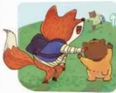
“多危险呀，你的妈妈呢？”小狐狸关心地问。熊宝宝指向慌张赶过来的熊妈妈。