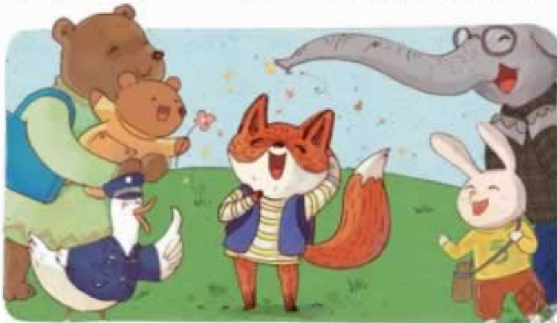
“谢谢你，你真是太棒了！”熊妈妈对小狐狸竖起了大拇指。其他动物也觉得小狐狸很棒，纷纷给它鼓掌。