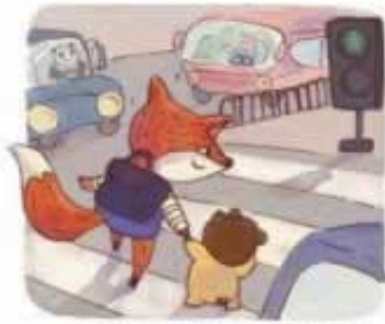
看到绿灯亮起，小狐狸赶紧跑过去牵着熊宝宝过马路。