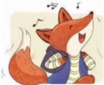
小狐狸高兴极了，它也觉得自己很棒，至少在帮助熊宝宝的时候。③

我们知道怎么办在碰到的时候，很多人都很大意，以为能赚到钱，就大额的下注，结果就只有两个，一是亏的一塌糊涂，连本带利的都亏本，那么结局肯定是辛苦钱的都没有，另外一个结果就是赚钱了，想快速出款到账，碰到黑平台或者大金额出款，直接不能出款，也就是这钱被黑了，完全不能到账了，连本钱都出款不了，因此我们要知道不能随便进行碰到，可能直接到账你的钱的损失，不要沉迷碰到，如果没有那个技术，不懂的控制自己的欲望，那么很多时候我们只能看看自己的辛苦赚的钱被黑了，但是如果这个时候有可以帮助我们的人，我们就可以解决这种碰