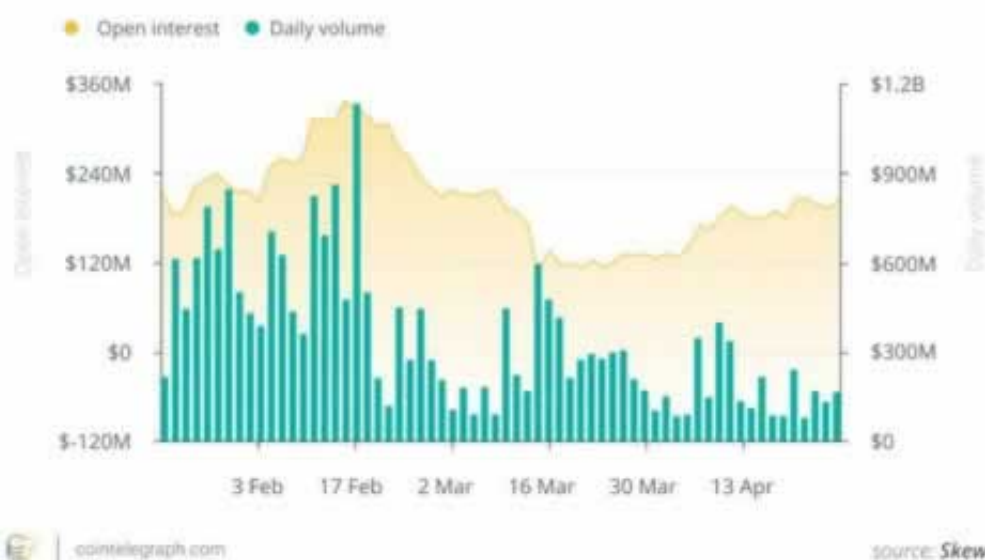
CME Bitcoin futures: Total open interest and volumes

这个问题可以解决不给出那意思就是不准备给你了呗,这个时候千万别再傻傻等喽,不然*后一分都没有了,我有点经验,可以帮你处理下网络游戏遇到提现失败,客服一直不给提现,一直说系统维护,财务清算等&#8230。