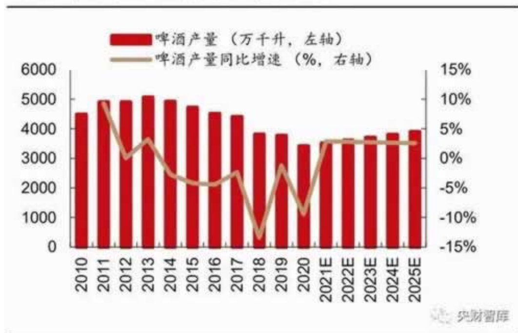
图 35：中国啤酒行业年产量及同比增速

答：专业解决在网上平台赢钱被黑的情况，一对一解决，当你不懂的怎么办的时候，我们就需要了解更好的办法，找我们解决就可以联系方式在屏幕底部，非常的安全靠谱。