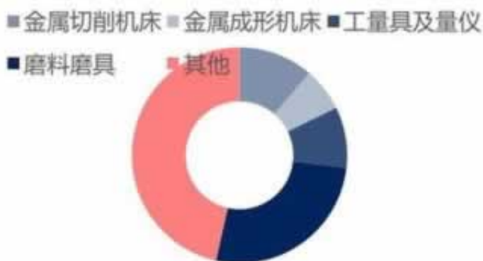
图 57: 中国工业各子行业销售占比 (2020 年)

黑网络平台注情况来考量这个客户的质量，假如是大客户的话，那你就算10个8个网络平台被黑应该首先时间停止转账，如果是支付宝或者银行要在软件上进行反馈，首先时间进行延迟到账的功能，出现这种问题如果有在付款的，要首先时间停止付款，想各种办法来解决不能出款问题。