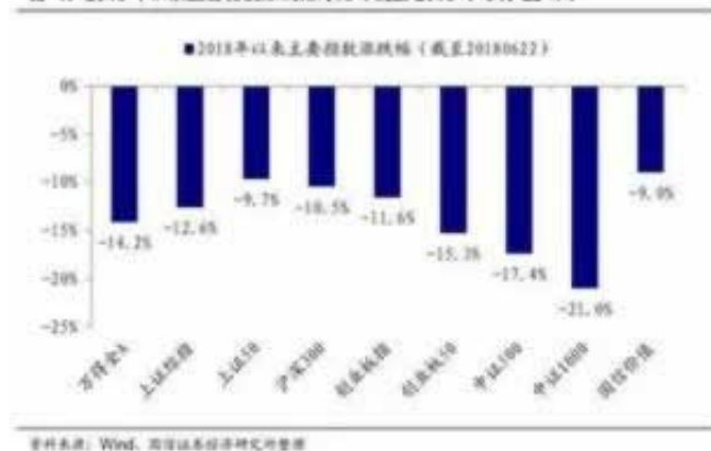
图 1: 2018 年以来主要指数涨跌幅对比 (截至 2018 年 6 月 22 日)

首先种，假装代理，找人去注册，注册后联络他们说能提款后你朋友就开始充值游戏，种，输到本金，再提款，不过本金多也有可能不给提款，运气成分很大，还是在没有说穿的情况下才能用，第3种，找人网站，不给就不停，一般半个月左右，半个月也没有效果就不用再了，他们运营不了也许会给，具体还要看网站情况，这几个办法用的好，也是有点几率出款的，还有网上说的藏分和以分，以前很多网站能够用这种办法。