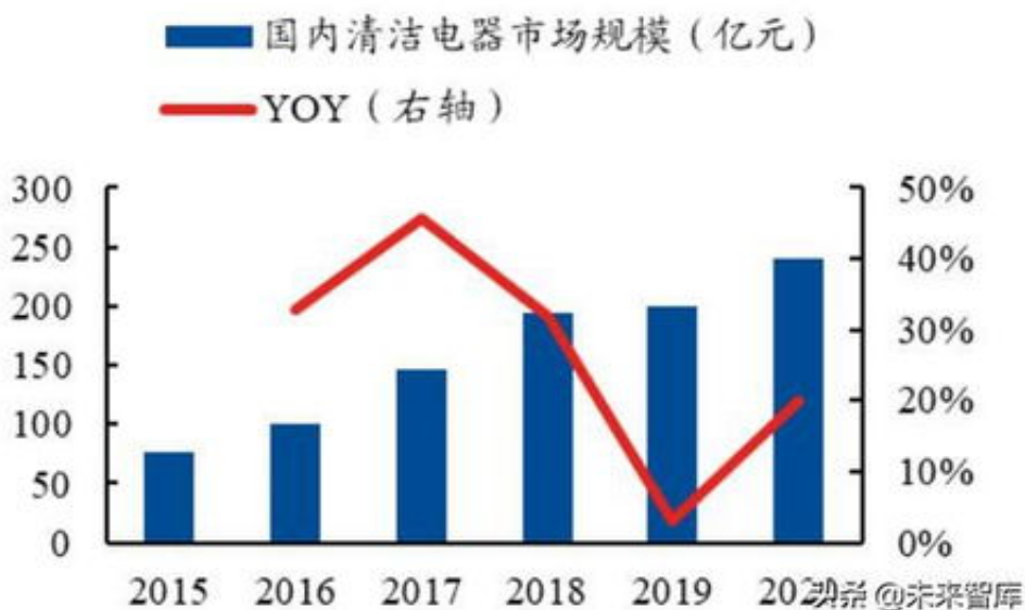
图 60、2015 至今中国清洁电器零售额情况

答：要重视起来当你不懂的时候，我们就要小心了，很多黑平台都是会后台操作的，限制你的出款，理由也是各种各样的，包括出款通道维护，取款通道为了不能出款了，这些我们的都是碰到了，那么相信是有解决的办法，因为我们已经有解决过来，很多难友通过我们已经解决了过来，所以网上这种情况是有解决的办法，这个办法其中就是藏分技能，就是其中的解决办法。