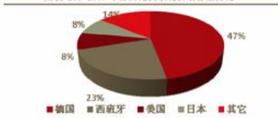
图表 28: 2007 年各国光伏系统新增容量占比