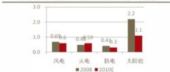
图表 27: 广东地区不同能源发电成本比较 (元/度电)