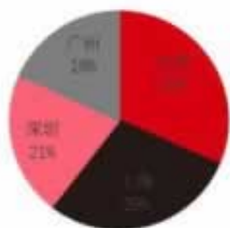
图 9：一线城市 3 月地产投资占比

上流水打够就可以提款了，下面解决经验可以参考下不要和他们纠缠，如果您盈利数额超多，你要是还一直纠缠，只会带来封号不要重复提取，一般两次提取失败，就是被后台拒绝审核了，你要是还一直在提，也是会带来封号。