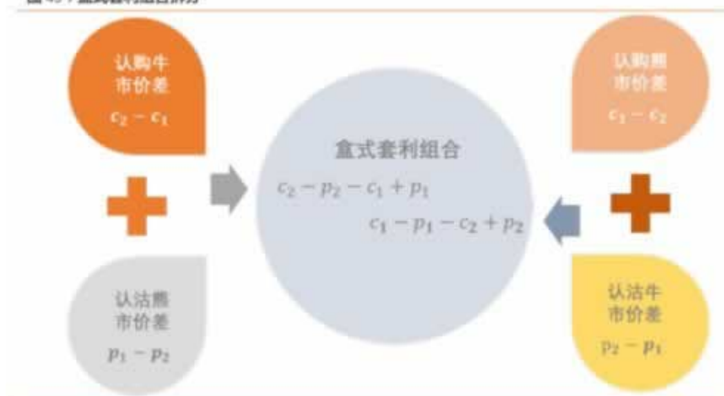
图 49：盒式套利组合拆分