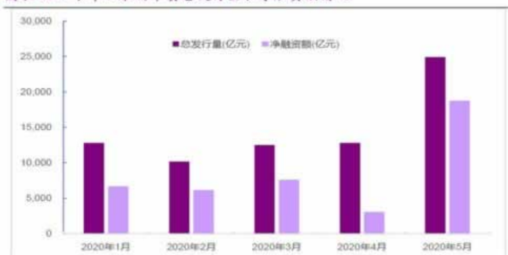
图表 22：今年以来利率债总发行量和净融资额情况

答：遇到黑平台系统维护不给出款才能出款网络平台上被黑怎么要怎么处理了，那么到底要如何快速解决出款的问题，其实大家相信觉得有点难的，其实现在已经有很多出黑工作室，可以帮助我们的，我们并不是一点机会都是没有的，如果你了解过藏分技能，那么真的就相信出黑工作室的，他们通过自己的这方面的经验，帮助我们解决不给出款的问题，帮助了我们把风险降到至低了，所以网络平台上被黑藏分技能靠谱吗。