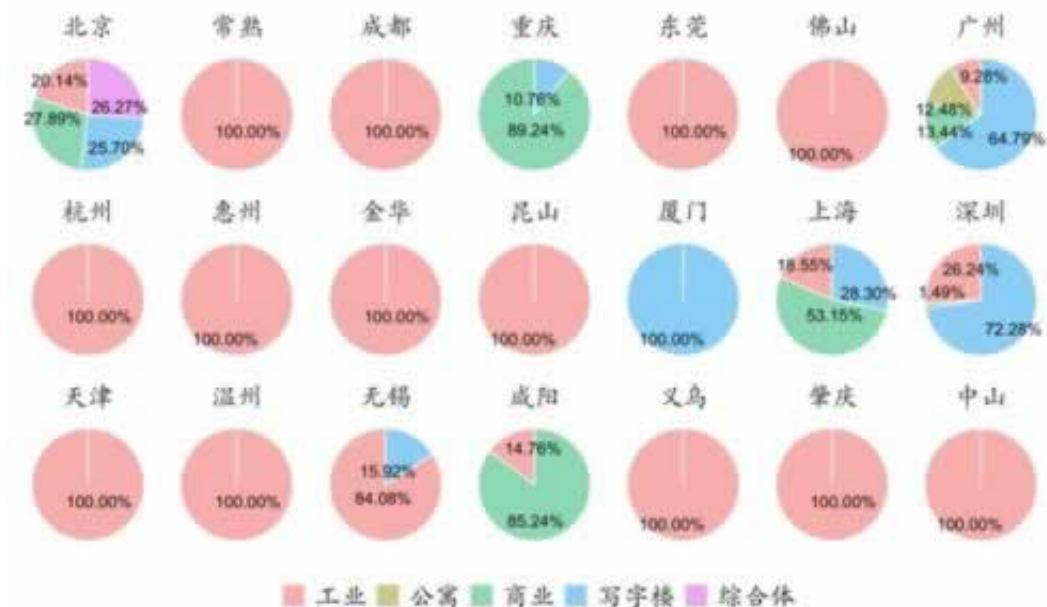
图：各城市大宗交易物业类型占比（按成交额） (2020年第三季度)

答：网上赢钱提不了现的解决办法：很多什么都不懂的人，一旦遇上提不了现的情况就会特别的着急，时间跑去跟客服吵，这个操作会直接导致账号被封。