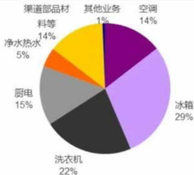
图 24：海尔收入结构：冰洗占据半壁江山（2019 年）

答：在王头提款提不了财务清算提不了款怎么办怎么辨别王头平台真假，才能不被黑，但是建议不要玩这类王头，不玩就是赢。