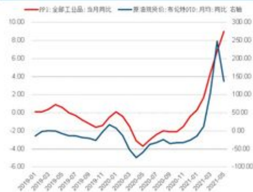
图 22: PPI 同比与原油价格同比 1,2