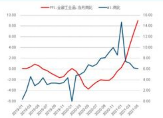
图 23: PPI 同比与 M1 同比 1,2