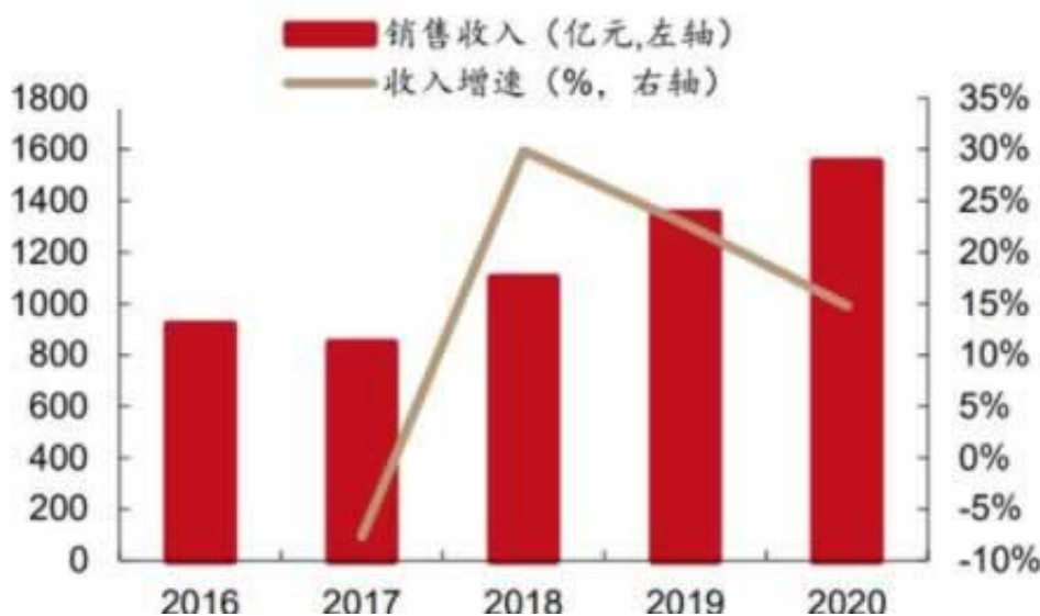
图 25：酱酒收入及增速

答：遇到了怎么办好浩天有能力长按复制：解决网上不能出款问题，不成功不收费，欢迎咨询浩天有能力(seeall)碰到黑网如果被黑数据未更新提现失败，不能出有办法不-年4月6日黑平台被黑不给解决办法，过来人告诉你如何出-年4月6日网络上被黑流水不足不给提款怎么办。