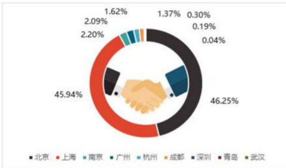
图：中国长租公寓股权融资金额城市分布

答：碰到取款一直风控审核中提现失败，下面5点解决办法，希望大家认真看看在网上被黑的情况出现了不要和客服理论，特别是盈利很多，出款要很多的时候，一定要记住不要跟客服吵，如果你一直纠缠可能会直接到账被封号的，特别是他们会找各种问题来应对你，比如系统维护，违规操作，财务审核不通等理由推脱。