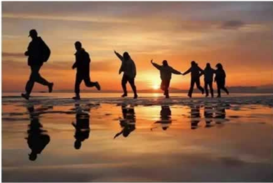
▲ 2021年11月28日，山东省烟台市一处海滨沙滩，一队晨练的大学生正在跑步。

何处是生门，何方有出路？谁能争得先机，谁能笑到最后？唯主动破局，果断开局，抉方向，择先机，方能萃取绵绵不断的力量。