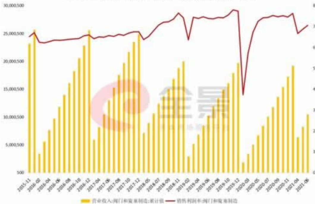
2015年至今行业收入（万元）及销售净利率（%）

答：们有专业一流的解决方案，对于在网上遇到的平台审核不通过，注单异常不能出款的问题，我们有很多成功的案例，成功率是非常高的，比自己跟平台去理由强，因为你玩的这种一点受保护都没有，报警也充公的，所以建议大家还是不要碰这种，如果是不小心玩上了，平台通过一堆借口不给你出款了，那么可以免费咨询我们，我们还可以把你出的，减少你这方面的损失。